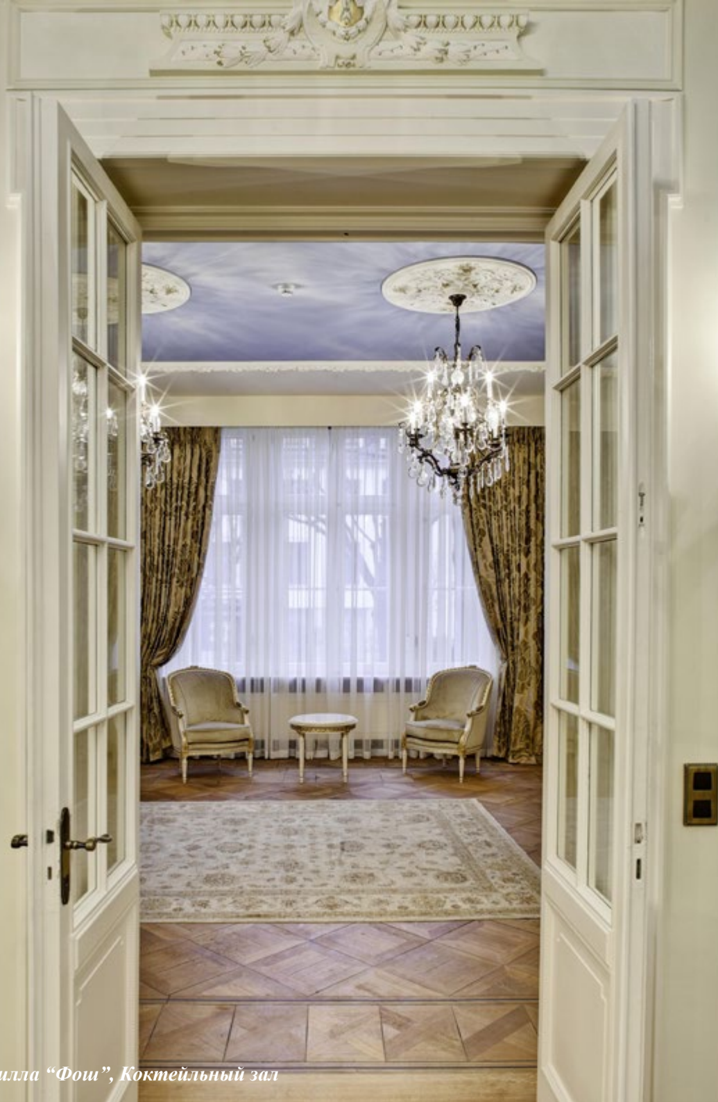
Вилла "Фои", Коктейльный зал