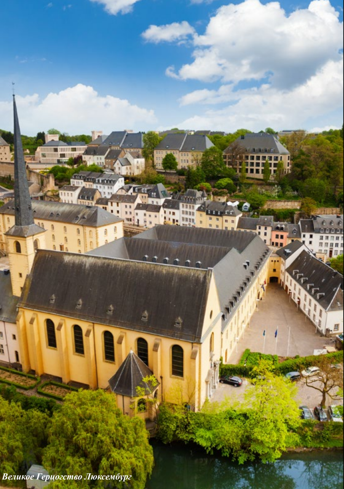
Великое Герцогство Люксембург