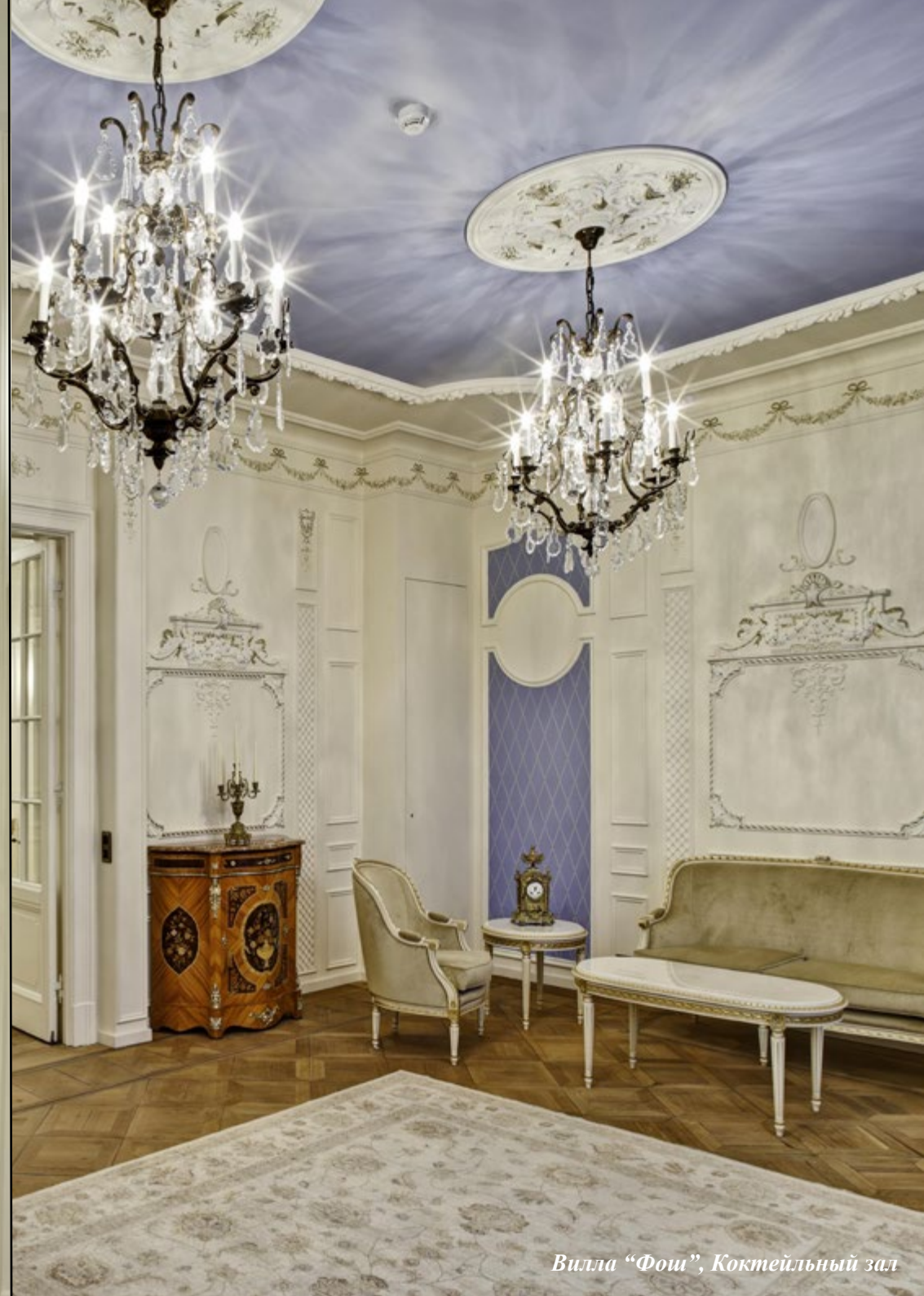
Вилла "Фои", Коктейльный зал