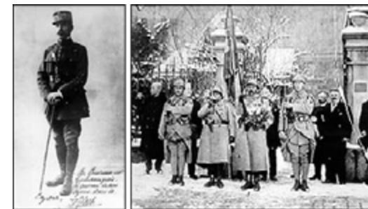
Маршал Фердинанд Фош (1851-1929), фотографии из архивов.

В 1918 году на вилле неоднократно останавливался герой I Мировой Войны Маршал Франции Фердинанд Фош, именем которого названа вилла.